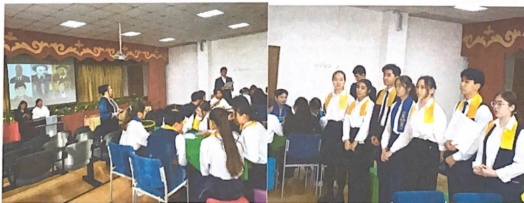
Тәуелсіздік мерекесіне орай «Терең тарихтан – жарқын болашаққа» қалалық интеллектуалды - танымдық турнирі

Мақсаты: Тәуелсіз Қазақстан мемлекетін өркендетуге, Тәуелсіздігіміздің шексіз, мәңгі болуына адал қызмет ететін білімді де жан-жақты дамыған, интеллекті жоғары, батыл текті, намысты ұрпақ, шынайы патриоттар тәрбиелеу. Өз Отанын сүюге, туған елінің тарихын, зиялы тұлғаларын тануға шақыру. Қатысқан оқушылар саны - 200.